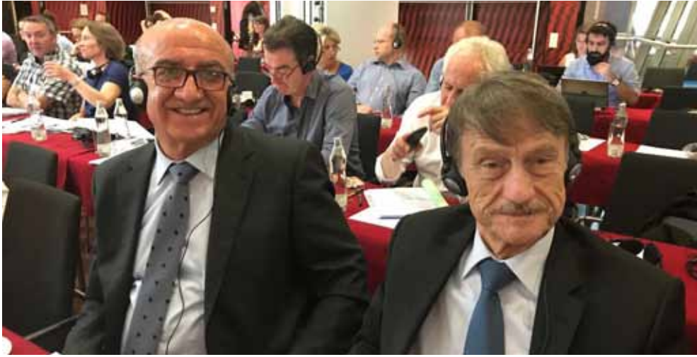
من جلسات الاجتماع

أوروبا عام ٢٠٢٠ بالإضافة الى الأمور المالية التي تتضمن تطور العضوية والانتساب والانسحاب من الإتحاد ومناقشة حسابات عام ٢٠١٧ وموازنة عام ٢٠١٩، ورسوم العضوية لعام ٢٠٢٠، وناقش الاجتماع تاريخ عقد الاجتماع القادم. هذا ومن المعلوم أن نقابتنا عضو في المكتب التنفيذي لشبكة النقابات الدولية لمنطقة آسيا والباسيفيك.