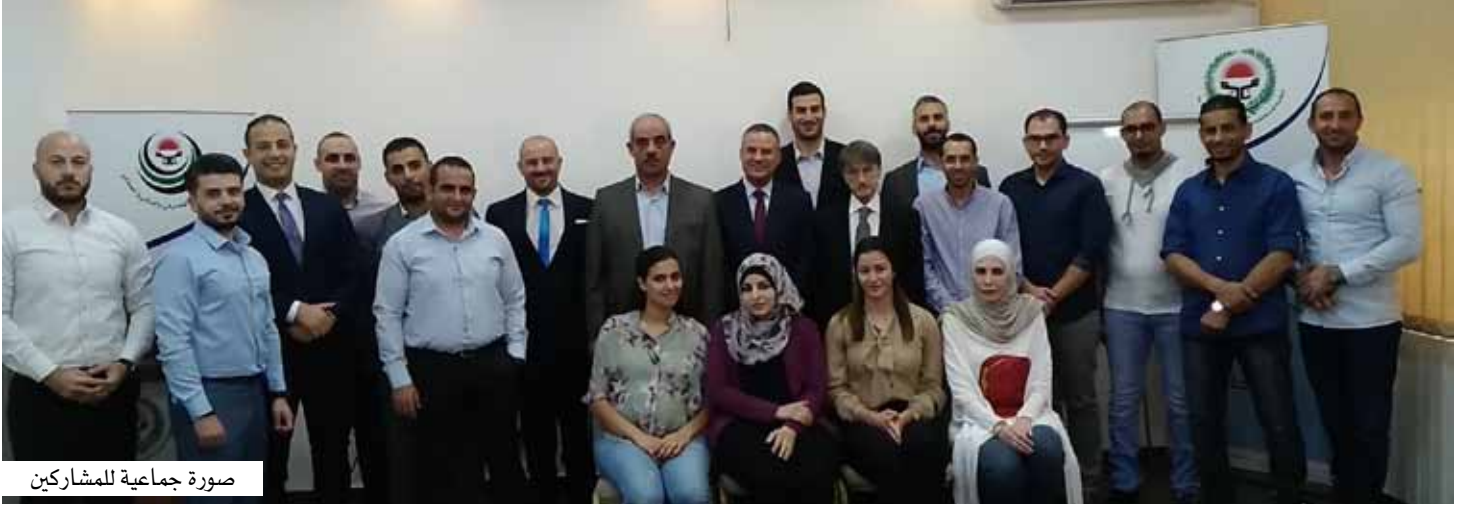
صورة جماعية للمشاركين