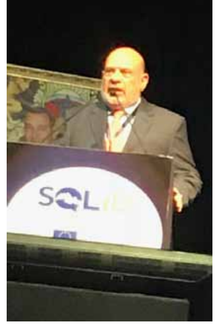
رئيس الاتحاد العربي الجديد

الثالثة للمؤتمر انتخاب أعضاء المجلس العام وانتخاب السكرتير التنفيذي بالإضافة الى استكمال كلمات الضيوف، ورؤساء وفود المنظمات الأعضاء، وفي الجلسة الرابعة الختامية ناقش أعضاء المؤتمر اللوائح القطرية والنوعية واللائحة العامة واللائحة الداخلية، وقبل اختتام اعمال المؤتمر تم تكريم عدد من قدماء النقابيين العرب.