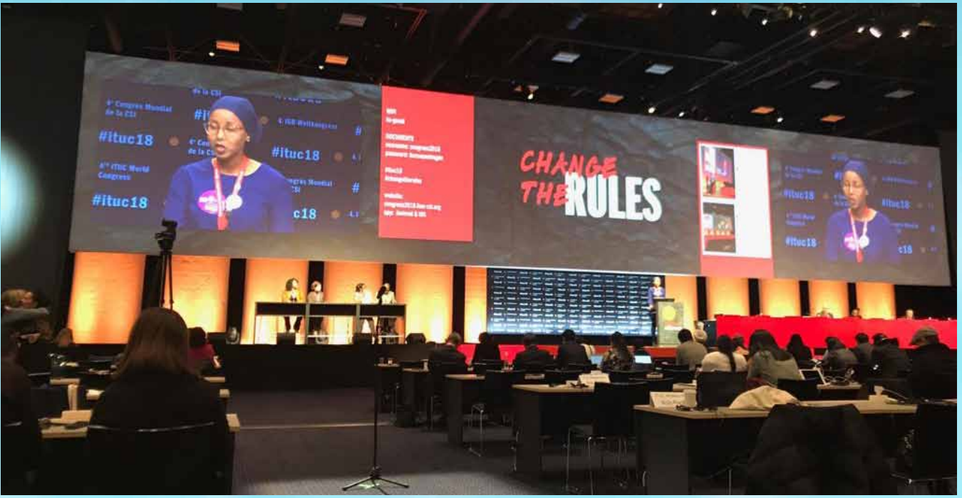
من جلسات المؤتمر

تنافس شديد وأجواء ساخنة تسود المؤتمر لانتخاب الأمين العام وفشل جديد لإسرائيل