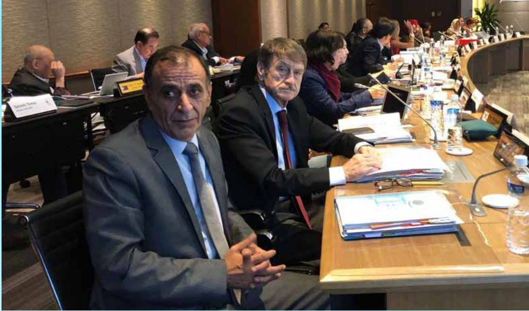
وفد الإتحاد العام في المؤتمر

الوفود المشاركة تشارك في الاحتفال بالذكرى السبعين لتأسيس الإتحاد العام لعمال تايوان