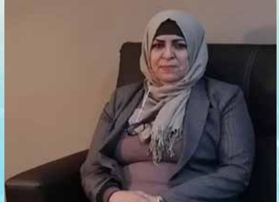
المدير الإقليمي لمصرف الراجحي

تلقت الهيئة الإدارية للنقابة العامة تفويضاً خطياً من العاملين في مصرف الراجحي للتفاوض مع الإدارة الإقليمية للمصرف حول عدد من المطالب العادلة والتي كانوا قد بحثوها مع الإدارة دون الوصول الى نتائج إيجابية، وقد قامت النقابة في ضوء ذلك بتوجيه مذكرة ودية الى الإدارة الإقليمية من أجل تحديد موعد لعقد اجتماع مشترك لبحث هذه المطالب، وبدلاً من تحديد هذا الموعد قامت الإدارة بتوجيه كتاب الى النقابة لا يمت بصلة الى مطالب الموظفين أو مذكرة النقابة، واستمرارا لسياسة التجاهل والابتعاد عن المسار القانوني بدأت بمطالبة الموظفين بالتخلي عن مطالبهم، الأمر الذي استدعى تأكيد موقف النقابة بالسير بالإجراءات القانونية من خلال وزارة العمل حتى تحقيق المطالب العادلة للموظفين.