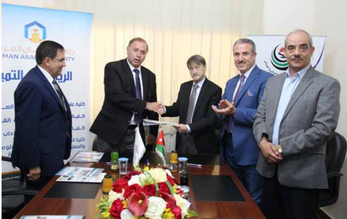
الاحتفال بالتوقيع على الاتفاق

على المشاركة في حضور المؤتمرات أو الندوات أو الدورات التدريبية التي يعقدها الطرفان بالإضافة الى المبادرات فيما يتعلق بإجراء البحوث والدراسات.