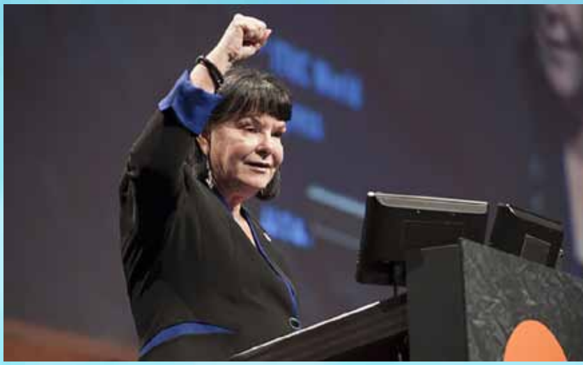
شارون بارو "إعادة انتخابها انتصار للوفود العربية"