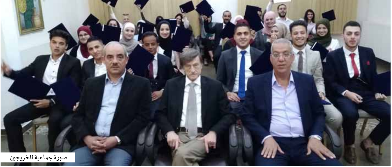
صورة جماعية للخريجين

بالبنوك أن تتوفروا على انفسكم فترة التدريب لدرجة ان البنوك عندما تقوم بتعيين خريج جديد من المشاركين في هذا البرنامج تتفاجأ بأنه ليس بحاجة الى تدريب البنك و يبدأ عمله مباشرة ويقوم بعمله بشكل ممتاز ، وبالطبع فنحن لا نريد - لا النقابة ولا مركز تدريب - ان نكون كشاهد الزور ، ولهذا فنحن نتمنى عليكم ألا ينقطع التواصل بيننا بعد التخرج سواء عملتم في البنوك او غيرها، وانا اؤكد ان ما يهمنا هو عدد المشتغلين من الذين شاركوا في هذه الدورة، فكلما كان العدد اكبر، سهل علينا ذلك ان نستمر بالحصول على دعم من صندوق التدريب والتشغيل والتعليم المهني والتقني، وتعاونت معنا البنوك اكثر من اجل التدريب، فأنتم عندما تشتغلون وتتواصلون معنا فإن ذلك يساعد الذين يأتون من بعدكم، وثانياً فإنكم اذا اشتغلتم في البنوك تكونون قد تعرفتم على نقابتكم التي أخذتم عنها المعلومات الرئيسة في هذه الدورة.