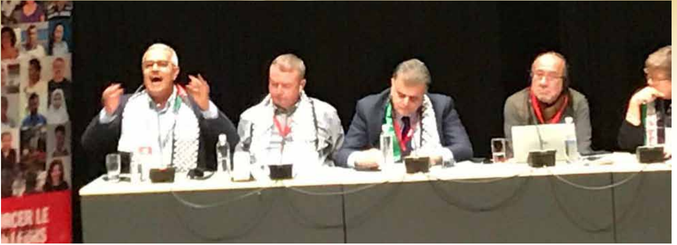
منصة الرئاسة للجلسة الخاصة بفلسطين

- نائب الرئيس الأول: الإتحاد العام لنقابات عمال البحرين