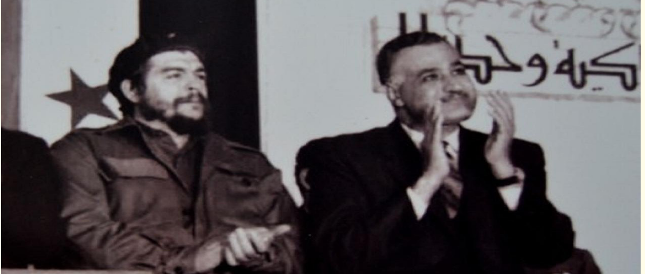
جيفارا مع الرئيس الراحل جمال عبد الناصر

والكفاح المسلح في تخليد ذكراه التي لا تزال خالدة في أذهان المناضلين من أجل الحرية حتى الآن وهو القائل ( لكل الناس وطن يعيشون فيه ... إلا نحن لنا وطن يعيش فينا )، وقد عثر على رفاة جيفارا عام ١٩٩٧ وتم نقله إلى كوبا في شهر تموز من نفس السنة حيث أعلنت كوبا عام ١٩٩٧ عاماً لذكرى آرستوتشي جيفارا.