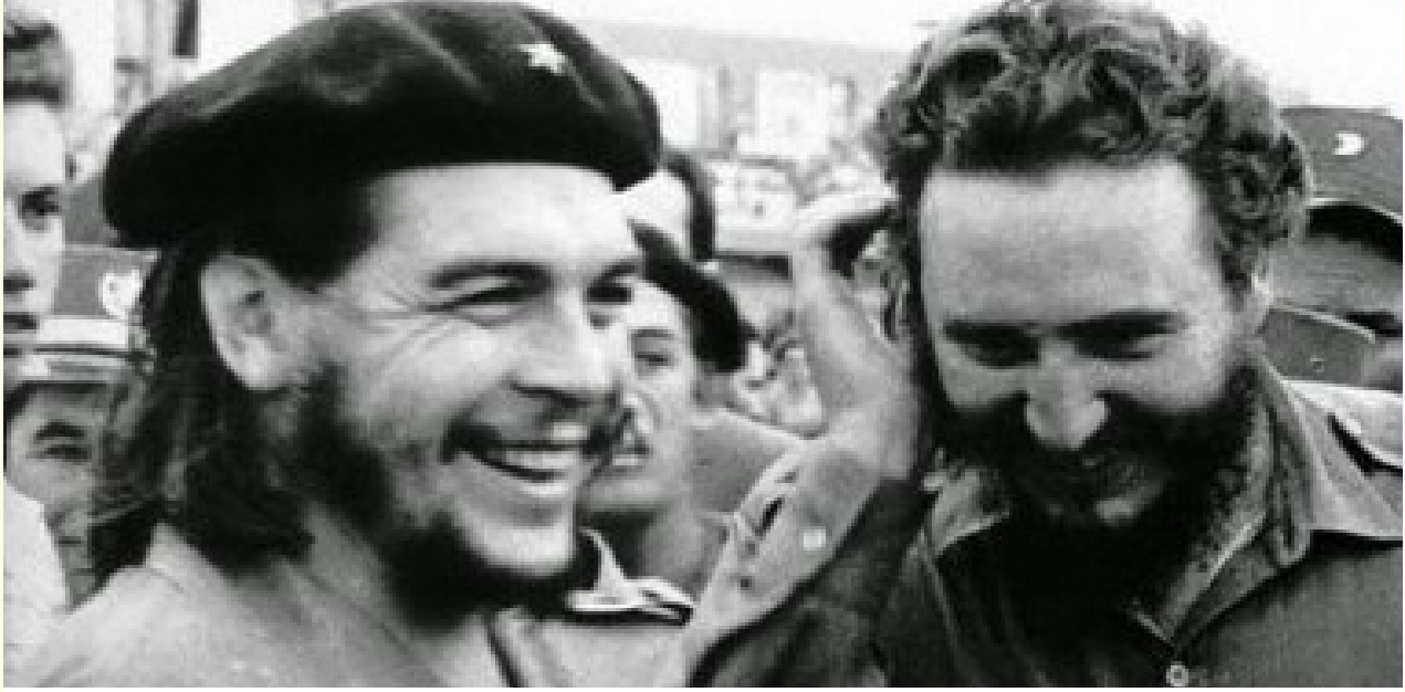
كاسترو ورفيقه جيفارا بعد انتصار الثورة

الأمريكية المتعددة من أجل إسقاطها وعلى رأسها معركة خليج الخنازير التي هزم فيها التدخل الخارجي، أما جيفارا فقد أعتبر أن انتصار الثورة الكوبية هو بداية مهمة جديدة لإنجاح الثورة بمضامينها التحررية والطبقية ونقلها الى دول أخرى تعاني من نفس المشاكل والظروف، وعندما وقفت الظروف أمامه للانتقال الى الكونغو من أجل المساهمة في النضال الثوري فيها كانت بوليفيا وهي أكثر دول أمريكا اللاتينية فقراً ومعاناة هي محطته التالية والنهائية، كانت بوليفيا التي سعى إليها لنقل تجربة الثورة الكوبية ومواجهة التوسع الأمريكي والتصدي للفقر ومعاناة الشعب البوليفي.