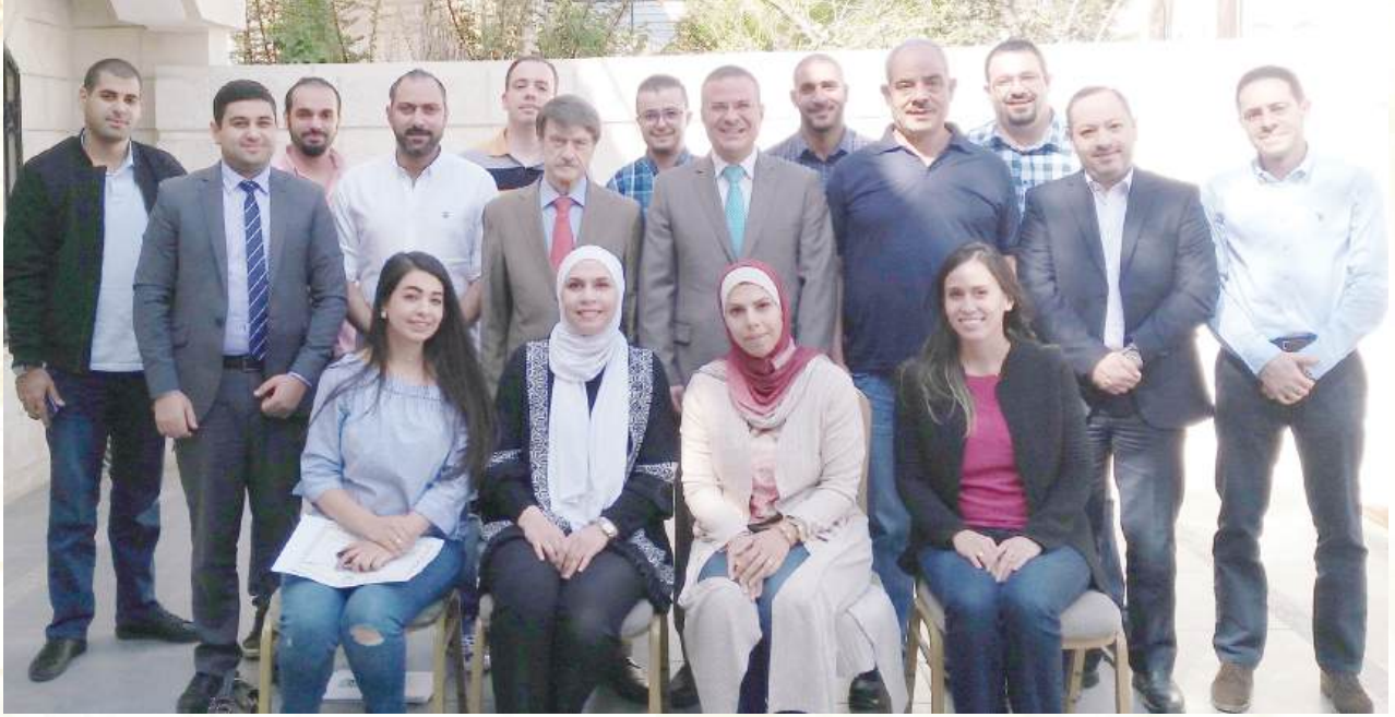
أختتام ورشة العمل الخاصة بالتمويل المصرفي